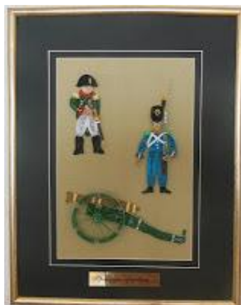
"Французы перед боем..."

Если сравнить со следующей картиной "Французы перед боем..." , где изображены французы, то станет понятно, какие были отличия в военной одежде у русских воинов и французских. Это же касается и индивидуального оружия солдат и офицеров.