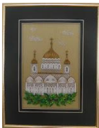
"Храм Христа Спасителя"

Благодаря этому современному искусству, при умелом подходе к организации учебного процесса, многие ребята с неподдельным интересом занимаются изучением истории России – читают не только о больших событиях, но и узнают мелкие подробности жизни своих предков.