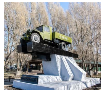
Памятник, посвященный памяти шоферов, погибших в годы Великой Отечественной войны, установленный в Самаре

29 мая – День военного автомобилиста. Праздник вошёл в армейский календарь современной России в феврале 2000 года. В годы Великой Отечественной войны автомашины использовались для буксировки артиллерийских орудий, снабженческих и санитарных перевозок, передвижения реактивных установок, личного состава войск всех без исключения фронтов. Настоящий подвиг совершили автомобилисты, осуществлявшие ежедневные маршруты по Дороге жизни, которая обеспечивала снабжение блокадного Ленинграда.