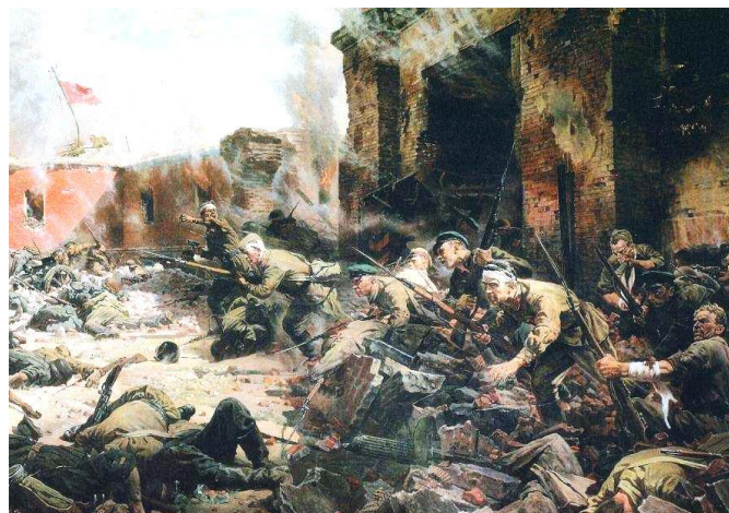
П.А. Кривоногов «Защитники Брестской крепости». 1951

Одно из самых первых сражений между советской и немецкой армиями в период Великой Отечественной войны. Гарнизон героически сдерживал натиск 45-й немецкой пехотной дивизии, которую поддерживали артиллерия и авиация. Очаги сопротивления оставались в крепости на протяжении месяца, отдельные защитники крепости продержались до осени. Оборона крепости стала первым, но красноречивым уроком, который показал немцам, что их ожидает в будущем. Подвиг героев нашёл отражение в книге Б. Васильева «В списках не значился» , С. Смирнова «Брестская крепость» , а также в одноимённом художественном фильме.