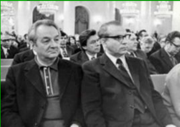
Сладков и Бианки на съезде писателей