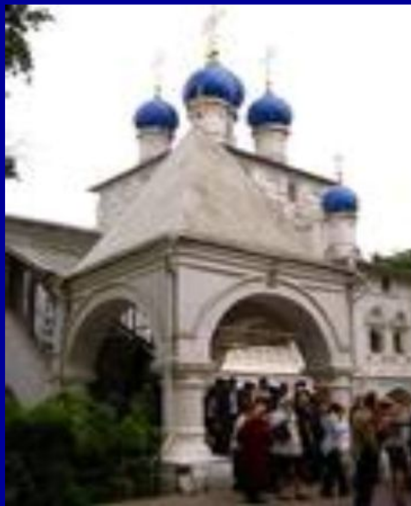
Коломенская церковь Казанской иконы Божией Матери

Богородица не любит, когда в доме ссоры, а в нашей стране часто были ссоры, непонимание друг друга, войны, поэтому не случайно 4 ноября в день празднования Казанской иконы Божией Матери возник праздник примирения и согласия.