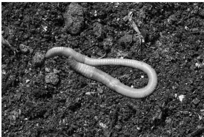
Дождевой червь обыкновенный

Анатолий и Виктория собрали разных животных для живого уголка. Для каждого животного им необходимо составить «паспорт», соответствующий положению этого животного в общей классификации организмов. Помогите ребятам записать в таблицу слово (словосочетания) из предложенного списка в такой последовательности, чтобы получился «паспорт» животного, изображённого на фотографии.